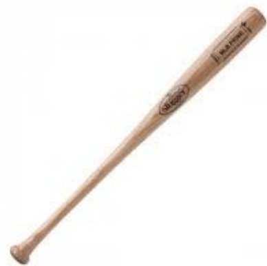
Batte de base-ball